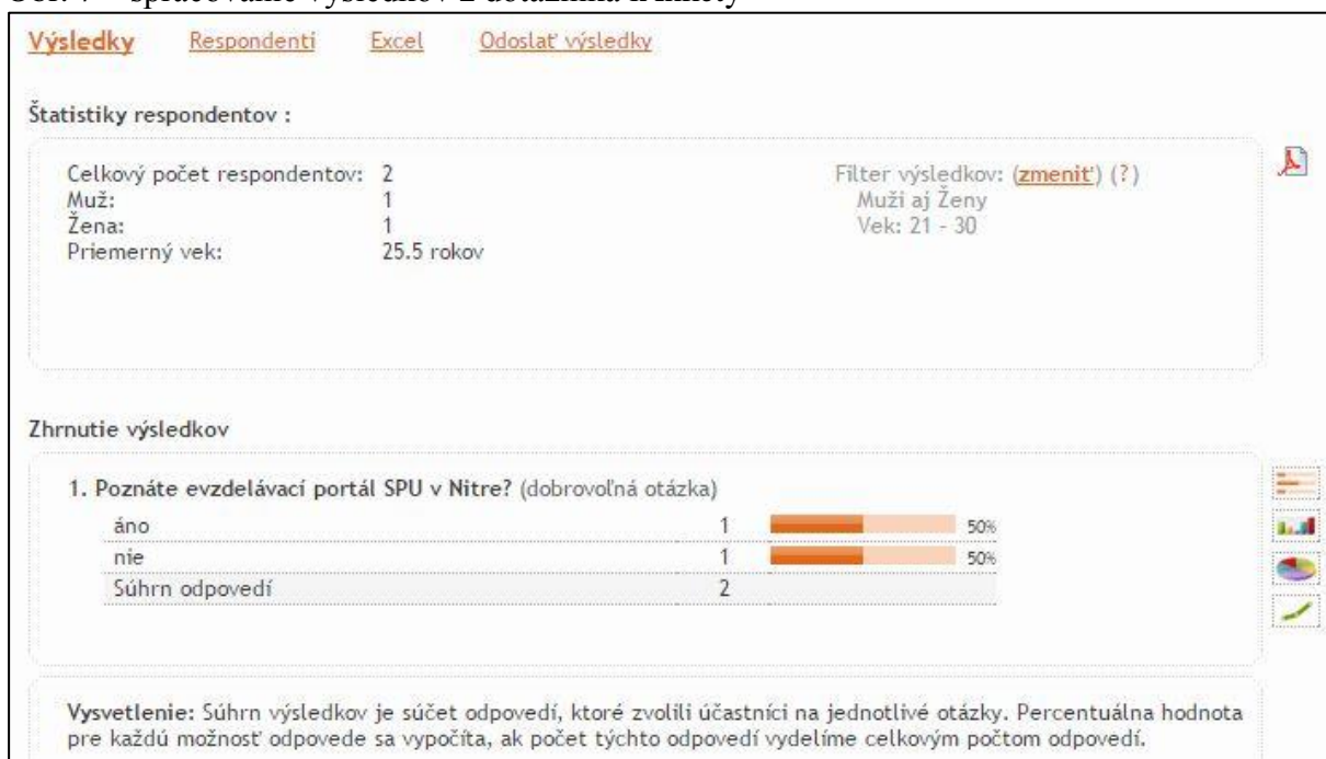
Obr. 7 – spracovanie výsledkov z dotazníka iAnkety