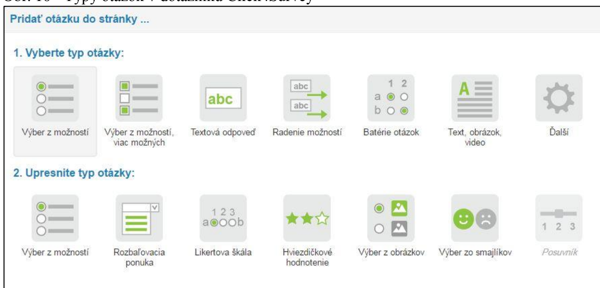
Obr. 10 - Typy otázok v dotazníku Click4Survey

Click4Survey je bohato prepracovaný nástroj, ktorý umožňuje komplexnú realizáciu a vyhodnotenie online prieskumov. Dostupný je z www.click4survey.sk . Poskytuje viacero typov účtov, od free účtu, ktorý nie je časovo limitovaný, až po prémiové účty, kde sa so zvyšujúcou cenou navyšujú aj funkcie pre vytváranie dotazníka. Systém umožňuje aj prémiový účet zadarmo odskúšať a to po dobu 14 dní. Okrem toho pre študentov, univerzity a neziskové organizácie poskytuje zľavu 70%.